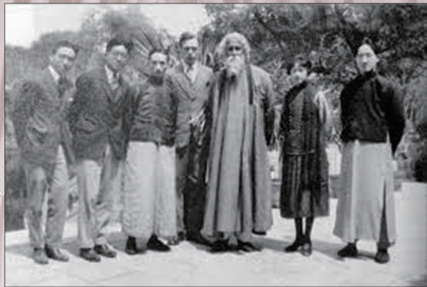
1924年林徽因与泰戈尔的合影。(左起为梁思成、张歆海、林长民、恩厚之、泰戈尔、林徽因、徐志摩)