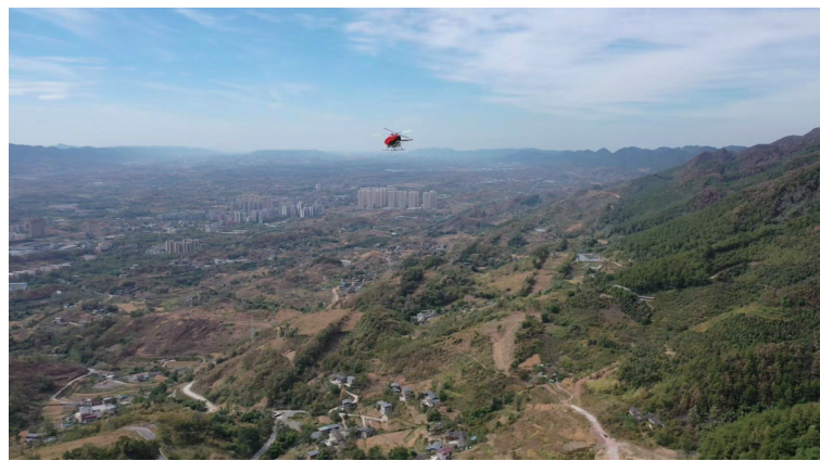
察打一体QH-120森林消防无人直升机在重庆缙云山上空。

本报讯 今年8月中旬以来,重庆缙云山的山火牵动着亿万人民的心。第五届中国国际“互联网+”大学生创新创业大赛冠军、清华大学“清航装备”交叉双旋翼无人直升机项目团队驰援重庆缙云山,以实际行动实践了大赛上的诺言,在打灭复燃火焰、物资运送和后勤补给等森林火灾扑救难题上贡献了清华学子的智慧和力量。