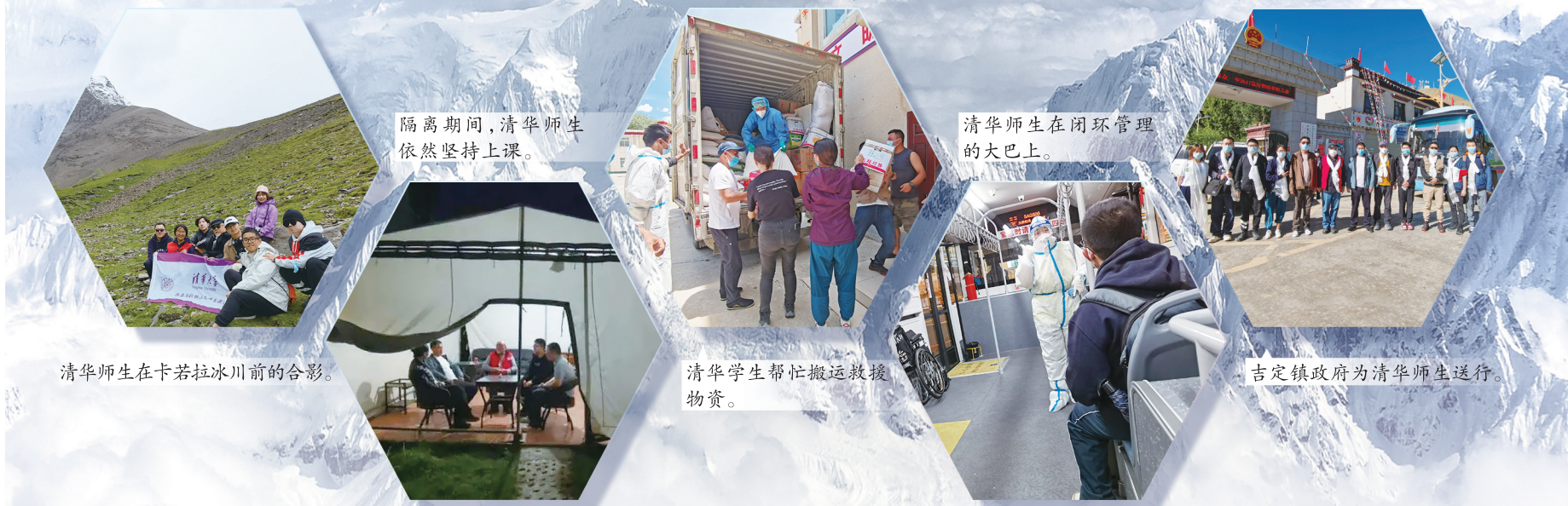
隔离期间，清华师生依然坚持上课。