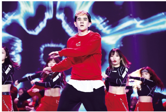
学生街舞社表演舞蹈《One to Start》。

本报讯 2020年12月31日晚,为保障全校师生员工的健康安全,清华大学2021年“云上”新年联欢晚会首次采用双语云端演出的方式,邀请海内外的全体清华人云端相聚。