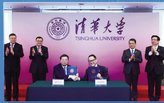
2019年成立清华大学-丰田联合研究院。