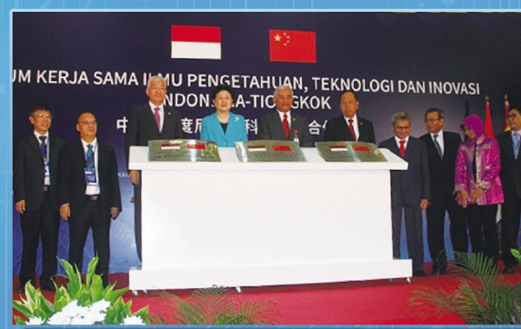
2017年时任国务院副总理刘延东为中印尼高温气冷堆联合实验室揭牌。