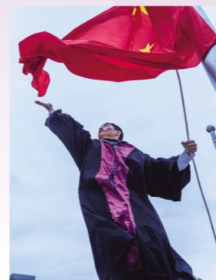
经求是 材科学院2016级本科生

曾获联合国UN75周年特别奖、联合国开发署UNDP青年创客赛成长组总冠军、中关村U30年度优胜者、第12届“挑战杯”中国大学生创业计划竞赛全国决赛金奖、第七届“创青春”中国青年创新创业大赛(全国赛)银奖,入榜“创世技”了“听见爱”公益项目,关爱听障儿童的成长。曾获清华大学抗击新冠肺炎疫情先进个人、清华大学在线教学优秀志愿者、庆祝中华人民共和国成立70周年活动清华大学先进个人、清华大学五星级志愿者、清华大学综合优秀奖、清华大学志愿公益优秀奖。