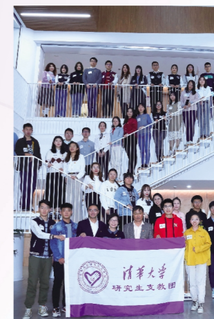
清华大学研究生支教团