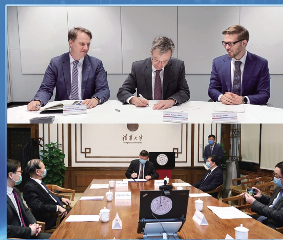
2020年清华大学-博世机器学习联合研究中心正式成立。