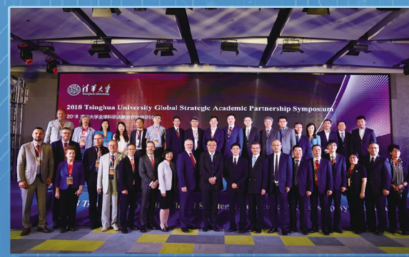
2018年在深圳召开第一届“清华大学全球科研战略合作伙伴研讨会”。