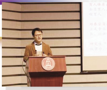
经管学院第三期“全民讲师计划”启动仪式现场。