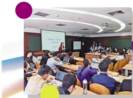
经管学院师生党支部联合举办“学风大讨论”活动。