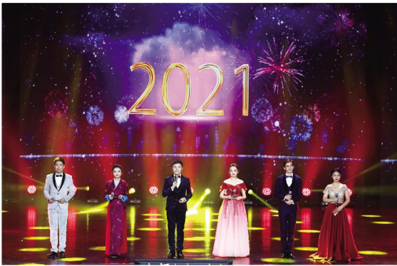
绚丽多彩的晚会现场。